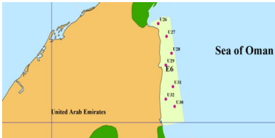
شكل 1.1 خريطة تظهر محطات مسح المخزون السمكي في بحر عمان

يأتي هذا المسح استكمالاً لمسح مماثل أجري في عام 2003 و 2013. وتبنى نتائج المسح المقترح على عينات المخزون السمكي باستخدام شبك الصيد القاعية. وقد طلبت وزارة التغير المناخي والبيئة من معهد الكويت للأبحاث العلمية تقديم مقترح لإجراء هذه الدراسة على طول الساحل الشرقي لدولة الإمارات العربية المتحدة (بحر عمان). يبين هذا الملخص المقترح الفني للإطار العام لمسح الأسماك القاعية من أجل تقييم الوضع الحالي لمخزون الأسماك القاعية الرئيسية ورصد التغيرات الناجمة عن ضغط الصيد.